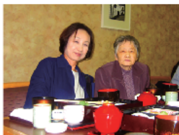
昼食はホテル日航倉敷にて。