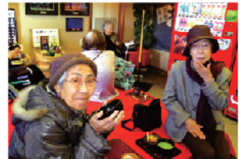
お抹茶と和菓子でちょっと一休み