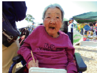
屋台焼きそば おいしいよ!