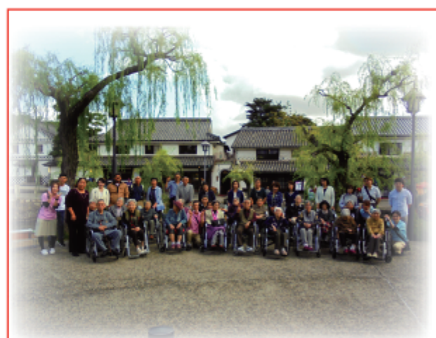
当日は天候にも恵まれ、絶好のドライブ日和となりました。倉敷川沿いの木々の紅葉や、柳並木にしばし時間を忘れて周辺を散策。