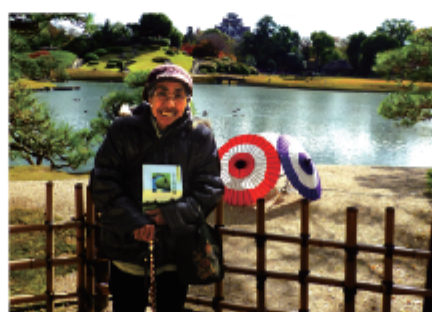
最高の秋晴れ！気持ちよくお散歩が出来ました