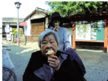
自由時間には風景を楽しまれる方や買い物を楽まれる方など、思い思いの時間を過ごしました。