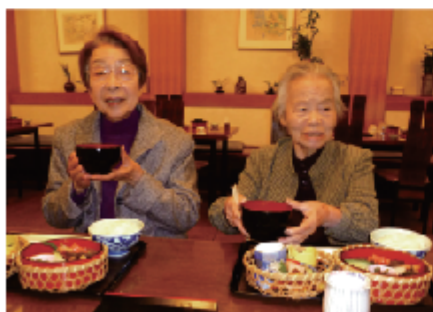
昼食は豪華な懐石料理に「あ～美味し！」