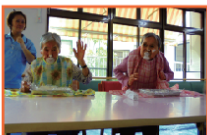
飴食い競争で真っ白に!