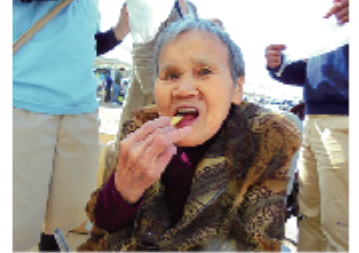
天気も良くて最高じゃ!