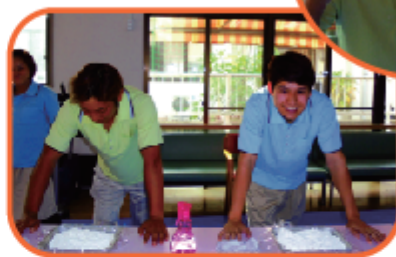
日本対ベトナム対決!?