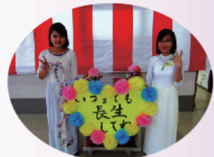
ベトナムの民族衣装でデザートを配りました