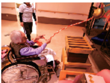
「願いを込めてお参り」