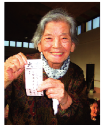
「大吉!いい年になります様に」