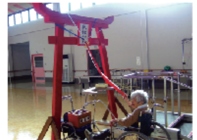
「家内安全をお願いしました」