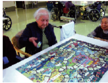
「真剣すごろく！ サイの目は??」