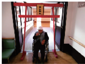
「初詣行ってきました」