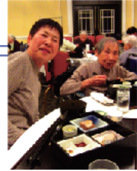
娘と孫の3人で来て嬉しかった！