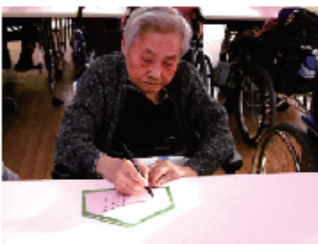
「今年の目標は・・・」