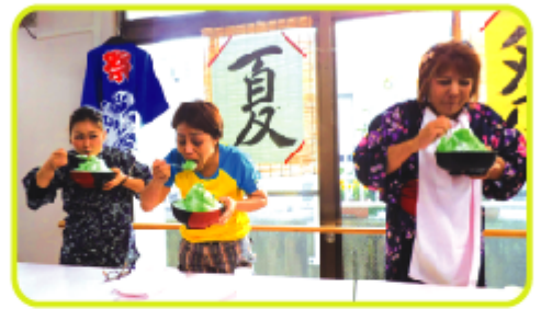
職員による山盛りかき氷の早食い!!