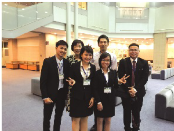
5月29日、幕張国際研修センター 開講式にて