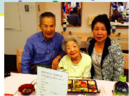
やっぱり家族と食べる食事が一番ですね！