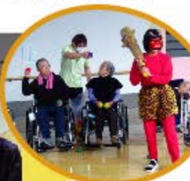
今がチャンスですよ！

鬼に扮した職員めがけ「鬼は外！福は内！」とカラーボールやお手玉を全力投球。思わぬ攻撃に職員もたじたじです。豆を食べるのも歳の数だけ…とは多すぎて出来ませんでした。皆さん大満足のご様子でした。