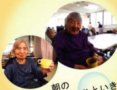
朝の ホッとひといき