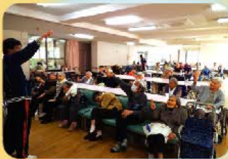
リズムに合わせて 踊ったり歌ったり♪