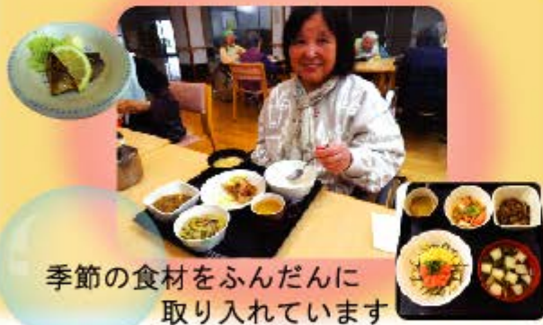
季節の食材をふんだんに 取り入れています