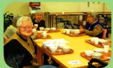
食事はみんなで楽しく